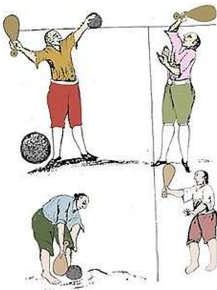
Plumisa LIII T. 2. 121 122. Mestizo de Lamas jugando a la pelota y a los gallos.